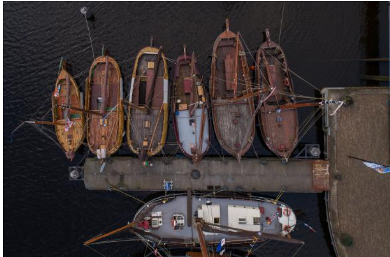
Het Skootje (helemaal links) samen met Wieringer en Lemmer Aken en Boppers tijdens de EOC-Traditionele Schepenbeurs in november 2017 in Den Helder.

Voor houten schepen is het een voordeel als ze een deel van het jaar op zout water liggen: het zeewater heeft een conserverende werking op het hout van de schepen.